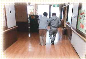
在宅復帰を目指して歩行訓練中!