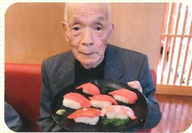
外出 おいしいお寿司

健康チェック、入浴、食事、その季節事の行事、レクリエーション等の様々なサービスを提供します。新しく機能訓練機械も導入しています。