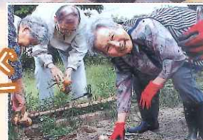
園庭で育てた野菜