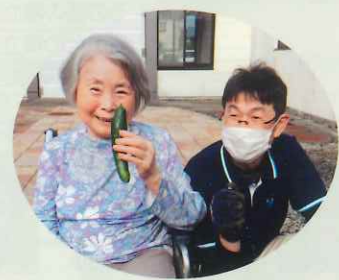
きゅうり獲ったど～