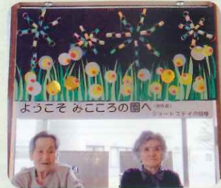
みんなで壁画作りました♪