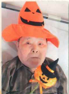
トリックオアトリート!!