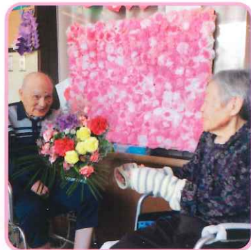
いつもお疲れ様です by母の日