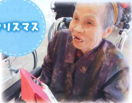
サンタからプレゼントもらった