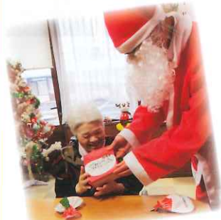
プレゼント？ありがとう