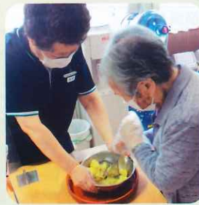
じゃがいもを収穫して ポテトサラダ作りしました♪