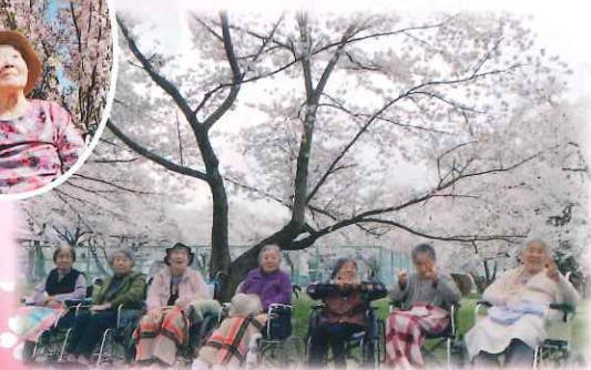
桜の木の下で記念撮影