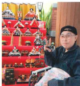
今日は楽しいひな祭り