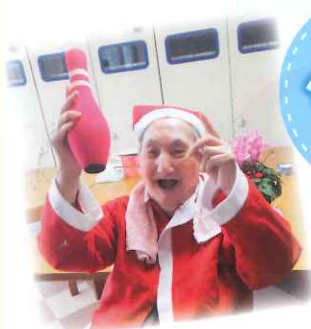
ゲーム一番とったー！！