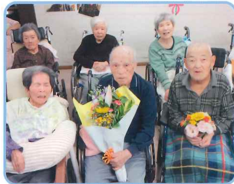
お父さんいつもありがとう