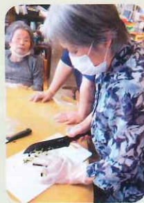
山形のだし 美味しかったよ♪