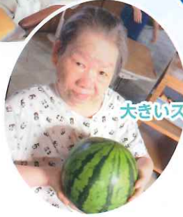
大きいスイカだね~