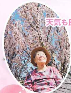
天気も良くて花見日和だ