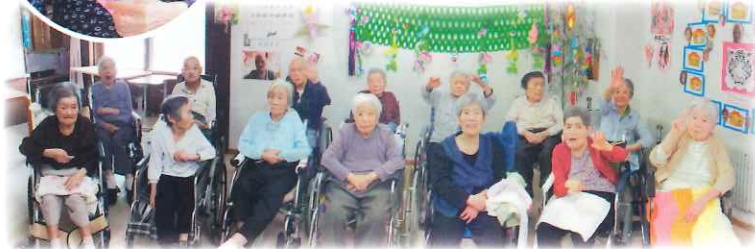
願い事が叶いますように by七夕