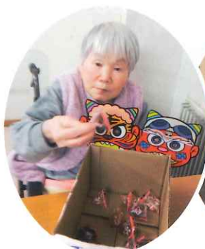
一緒に豆食べよう