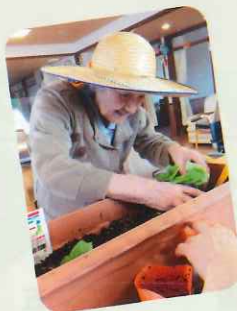
ゴーヤの苗植えしてま～す