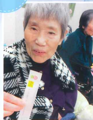
今年初めの運試し